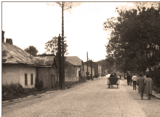
Dubiecko - ulica Przemyska