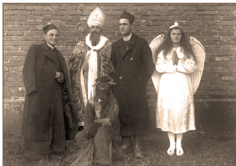
Dubiecko - kołędniczy lata 20-te