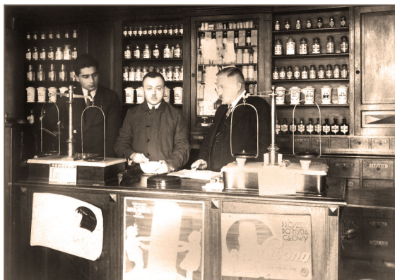
Dubiecko - apteka Grudzewskich