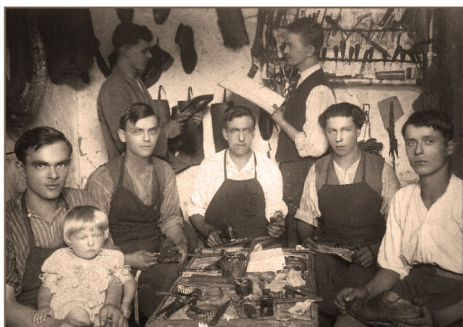
Szewcy z Nienadowej