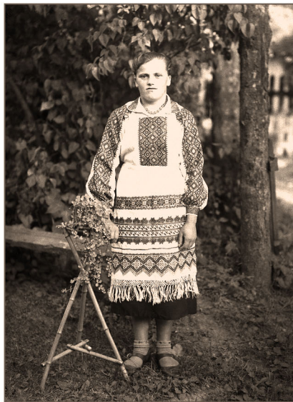
W odświętym stroju