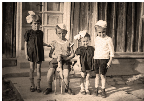
Dubiecko - może ktoś się rozpozna