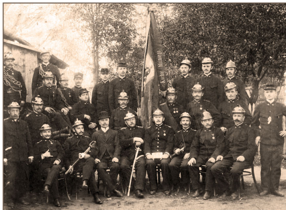
Ochotnicza Straż Pożarna - Dubiecko XIX w.