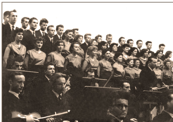
Dubiecki chór i orkiestra