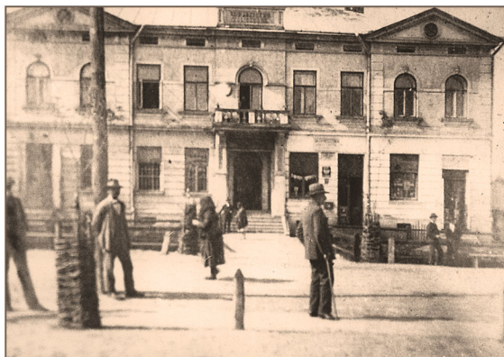
Budynek Towarzystwa Zaliczkowego - Dubiecko lata 20-te