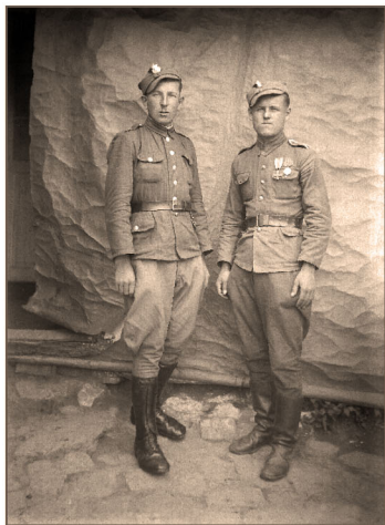
Żołnierze na przepustce