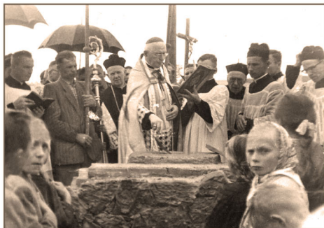
Wmurowanie kamienia węgielnego