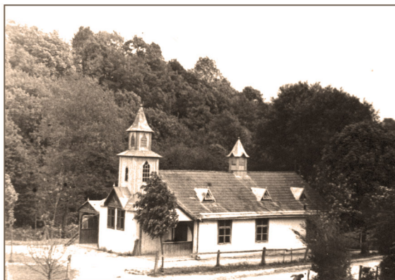
Drohobyczka k/Dubiecka - drewniany kościółek