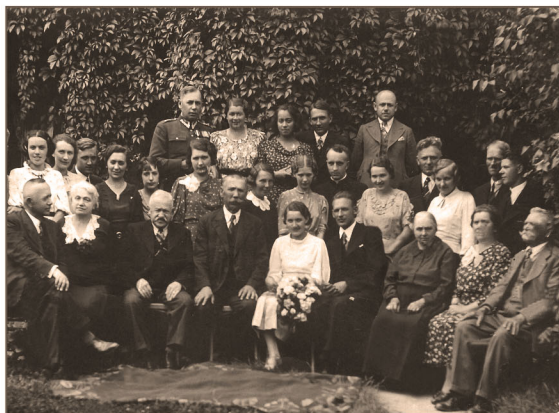
Dubiecko - fotografia ślubna