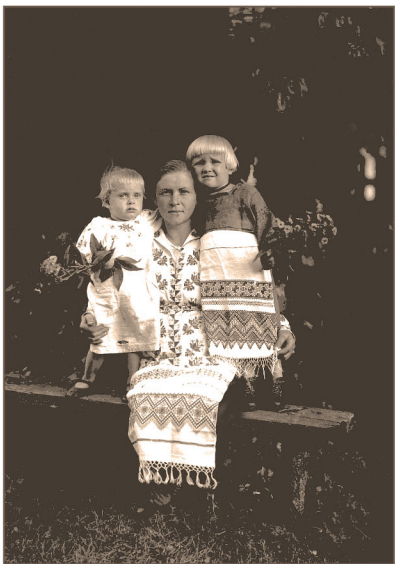
W odświętnych strojach