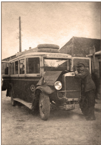
Autobus pośpieszny Przemysł-Dynów