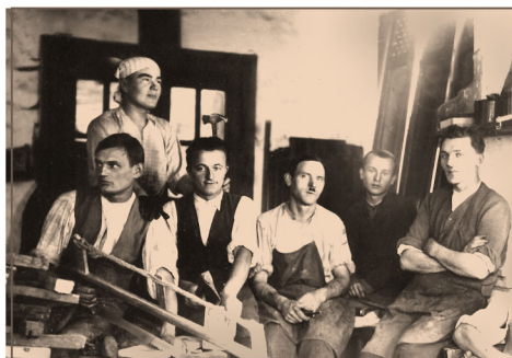
Dubiecko - warsztat stolarski