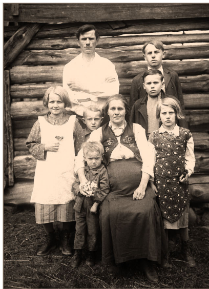
Rodzina w niedzielne popołudnie