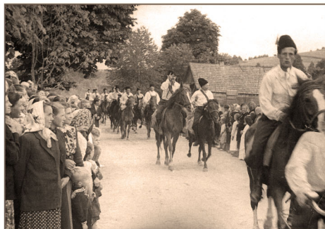
Powitanie biskupa w Drohobycze